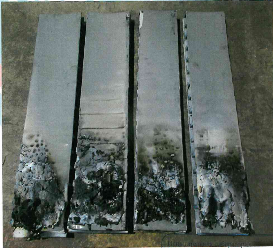
Рис.1 Фото образцов после испытаний

7.3 Результаты экспериментального определения группы горючести образцов материала представлены в таблице 3.